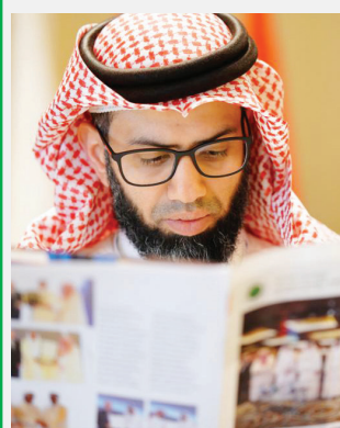
Abdullah Omar Al-Tamimi Courses of Conferences Sessions & seminars