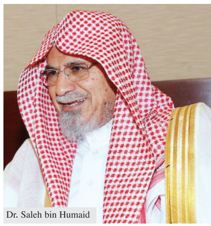
Dr. Saleh bin Humaid

Afterwards, H.E. Sheikh Abdullah Al-Mutlaq, advisor to the Saudi Royal Court, member of the Council of Senior Scholars, and head of several Shariah boards and committees in GCC based Islamic banks and financial institutions delivered a speech in which he stressed the importance of grooming the rising generation of young jurists to carry the torch from and keep the tradition from the